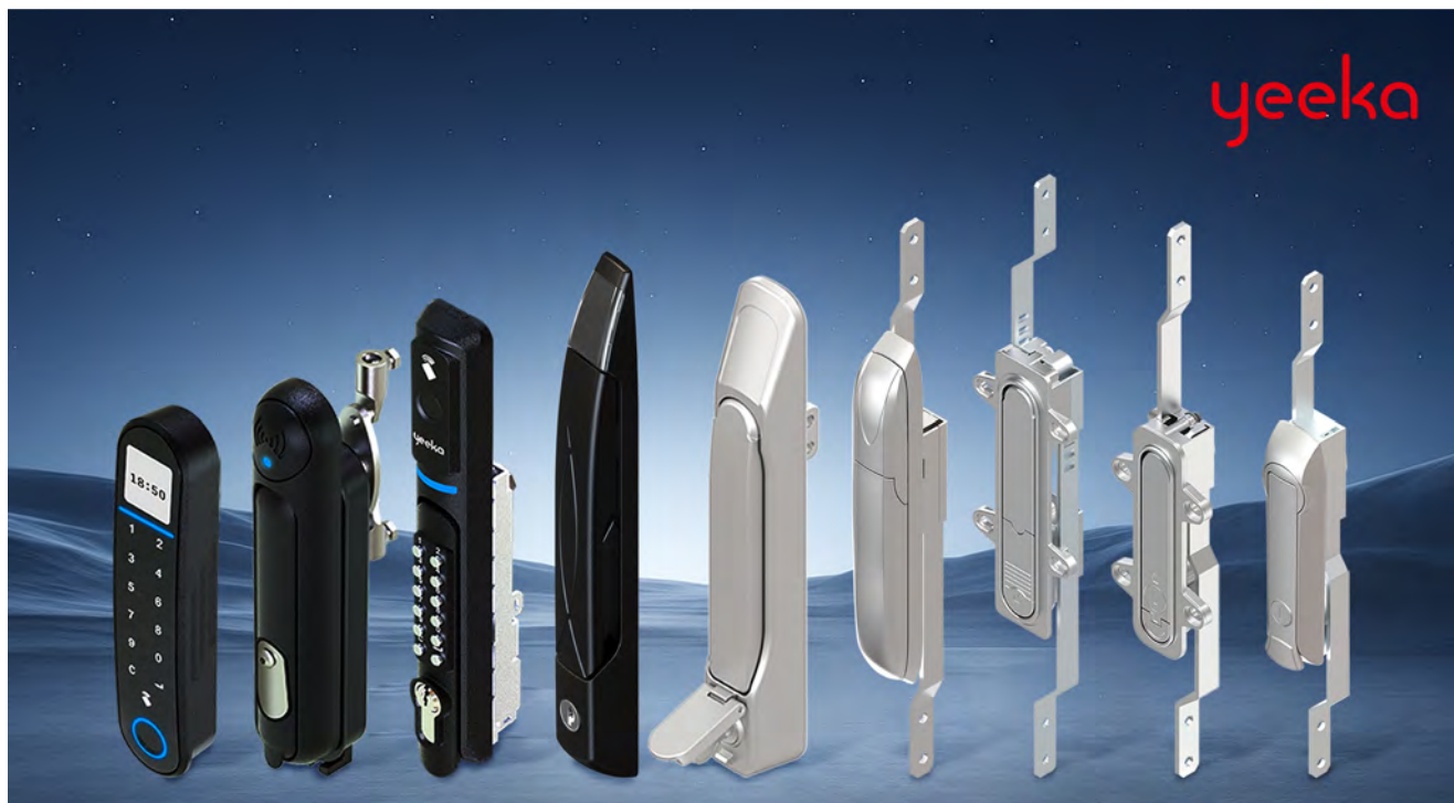
一卡锁具产品线：从传统机械锁到智能物联锁的完整解决方案