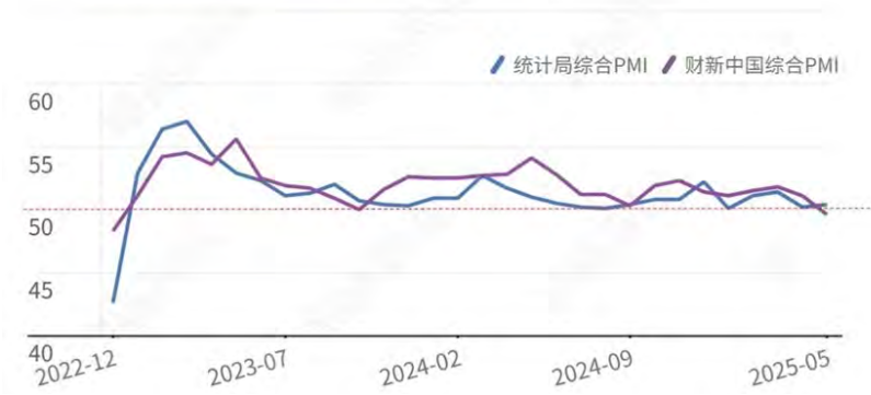
5月财新中国综合PMI2023年来首次收缩

据中国汽车工业协会分析，5 月，汽车市场延续良好态势，产销较去年同期实现 10% 以上的增长，且内需和出口均有较好的表现。其中，乘用车市场表现活跃，商用车市场仍有待恢复，新能源汽车继续快速增长，汽车出口增速有明显的提高。 5 月，汽车产销分别完成 264.9 万辆和 268.6 万辆，环比分别增长 1.1% 和 3.7%，同比分别增长 11.6% 和 11.2%。 1 ~ 5 月，汽车产销分别完成 1282.6 万辆和 1274.8 万辆，同比分别增长 12.7% 和 10.9%，产量增速较 1 ~ 4 月收窄 0.2 个百分点，销量增速扩大 0.1 个百分点。 5 月，新能源汽车产销分别完成 127 万辆和 130.7200 万辆，同比分别增长 35% 和 36.9%，新能源汽车 150 新车销量达到汽车新车总销量的 48.7%。