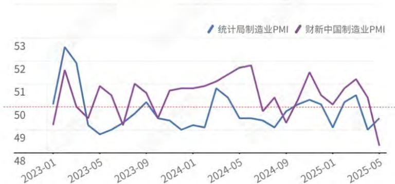
5月财新中国制造业PMI降至收缩区间

财新智库指出, 外部贸易环境不确定性加大, 二季度宏观经济指标走弱, 政策需评估消费政策效果, 改善就业和居民收入以拉动内需。