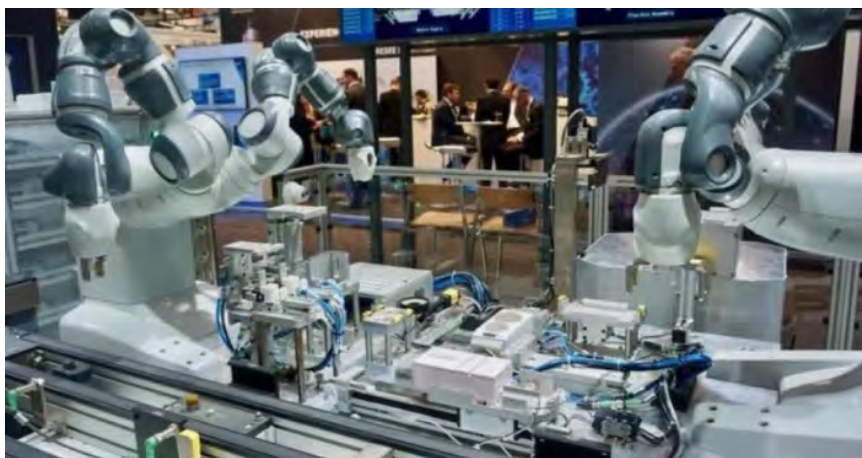
图 1 基于智能化控制技术的机器人协作产线

智能制造，AI 技术通过集成先进的机器学习算法和自动化技术，实现生产流程的精细化管理和智能决策，如图 1 所示为某国际工业化展会有关机器实时协作的无人产线。这不仅提高了生产效率，而且显著增强了产品质量和一致性。例如，智能化技术控制的产线，在