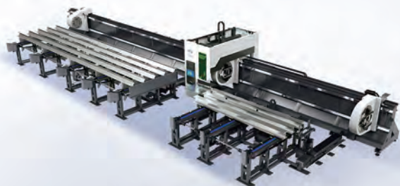
▲ 重载型激光切管机