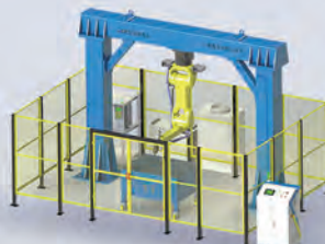
▲ 三维机器人激光切割机