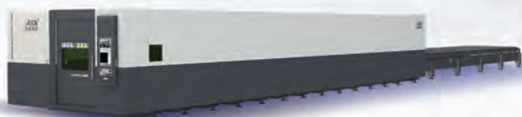
▲ 超高功率光纤激光切割机