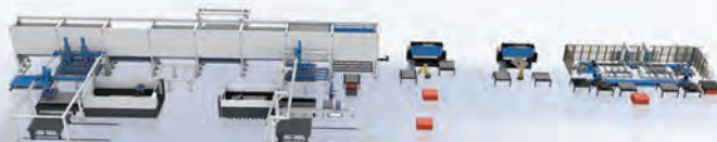
▲ 钣金加工智慧工厂