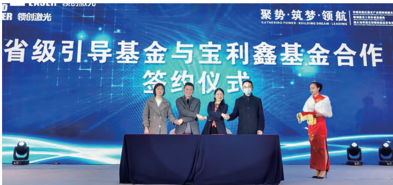
省级引导基金与宝利鑫基金合作签字仪式