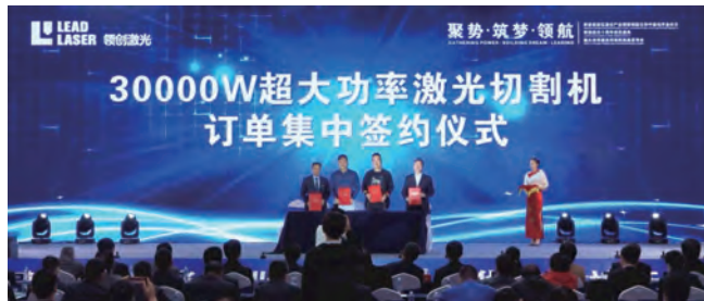
购买领创 30000W 设备的四家公司代表签约