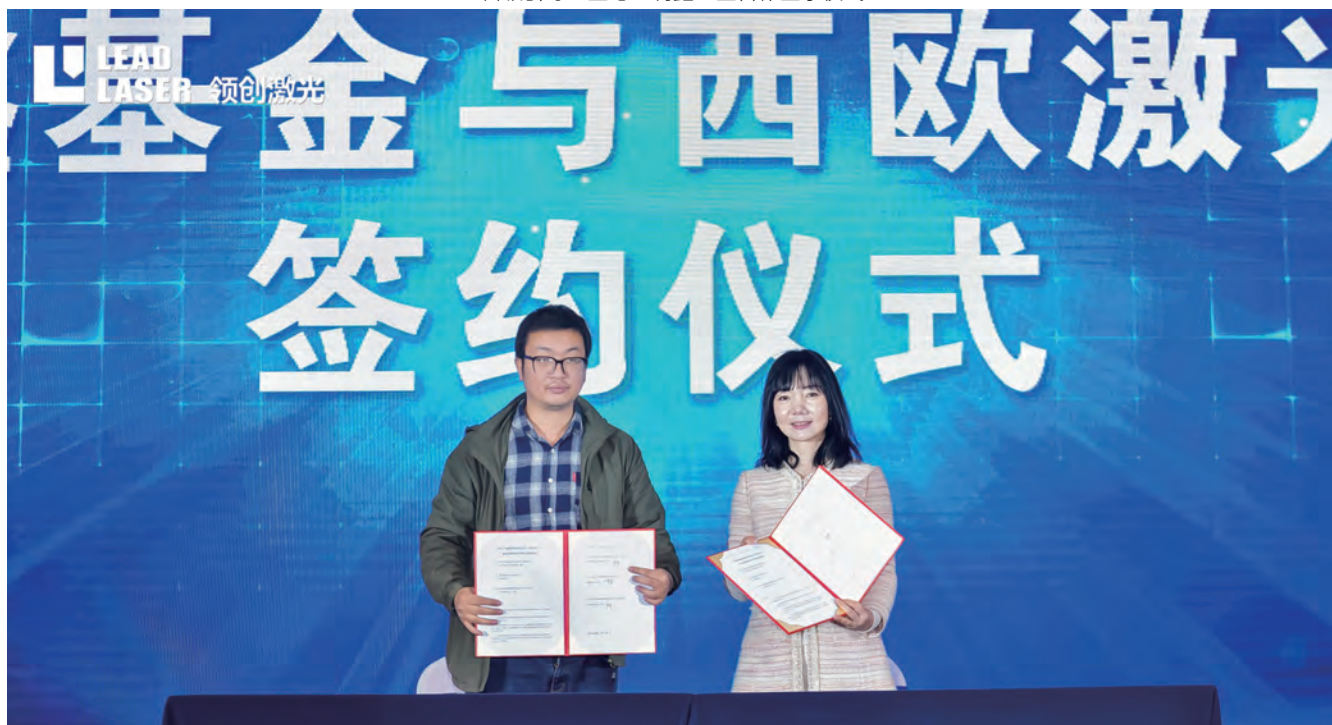
宝利鑫与西欧激光落户签字仪式