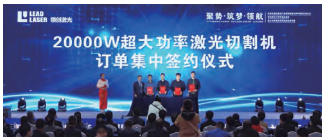
购买领创 20000W 设备的四家公司代表签约